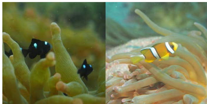
ミツボシクロズメダイの幼魚(左) クマノミの幼魚(右) いずれも昨年撮影

9~10月は海水温も高く、透明度も夏よりよくなるので、スキューバダイビングにはうってつけの季節です。岩漁港そばのダイビングスポットでは、例年秋になると、サンゴイソギンチャクにミツボシクロズメダイやクマノミ、キンギョハナダイの1cmにも満たないような幼魚が住み着きます。今年は、台風の影響でサンゴイソギンチャクがダメージを受けてしまいましたが、岩ダイビングセンターの方々が修復し、最近になってミツボシクロズメダイの幼魚が確認され始めているとのこと。今年もダイバーを楽しませてくれそうです。<情報提供：岩ダイビングセンター>