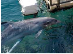
真鶴半島南側に現れたバンドウイルカの仲間(上段 2018年10月11日撮影) 頭部と背びれが見え、左方向に移動(左上)、背びれと尾びれの付け根が見え、右方向に移動している(右上)。 [参考]水族館のバンドウイルカ(左下)

10月11日、真鶴半島南側の岸から100m足らずのところに、バンドウイルカの仲間と思われる3頭の群れがいるのをディスカバーブルースタッフが確認しました。東西方向に行ったり来たり、およそ30分間観察されました。バンドウイルカの仲間は真鶴半島での定住は確認されていませんが、三宅島や御蔵島周辺に定住する群れが一時的に真鶴半島に回遊して来ることがあり、今回もその可能性が大きいでしょう。また、これまでに真鶴周辺ではイシイルカやカマイルカが目撃されています。さらにザトウクジラなども時折現れるようです。ぼーっと沖を眺めていると、運がよければ、イルカやクジラの仲間を見られるかも知れません。