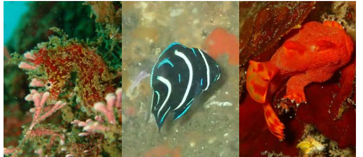
ハナタツ(左)、サザナミヤッコの幼魚(中)、イロカエルアンコウ(右)

10月は海水温・透明度も良く、ダイビングのベストシーズンの一つ。今月はダイバーに人気の生物がいろいろ出現しました。写真左はタツノオトシゴの仲間の「ハナタツ」。海藻に紛れています。中央は「サザナミヤッコ」の幼魚、右は人気者の「イロカエルアンコウ」。大きなものから小さなものまで、秋の海はとてにぎやかです。また、真鶴で出会ったダイバーのカップルの方たちが9月末に海中結婚式を挙げられました。