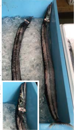
クロタチカマス(長スミヤキ)

台風シーズンも落ち着き、様々な魚が水揚げされています。魚も脂が乗る美味しい時期になってきました。イナダ、カマス、ウルメイワシなどが連日水揚げされています。ソウダガツオとサバは日によって水揚げ量に大きな差がありますが、水揚げの多い日ほど値段が安くなるかと思えば、そうとは限らないようです。ある程度まとまった数が揃うと、宗田節(そばつゆの出汁に使用)や鯖節の原料として加工会社が大量に買いつけるため、値段が上がるそうです。大型で脂の乗ったサバは鯖節には向かないため、逆にお手頃価格で手に入ることも…。