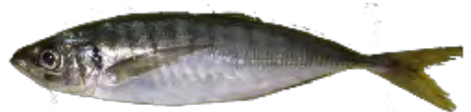
マアジ。体長25cmほどと大型で脂ものっていました。

イサキにムツ、ハモにアオリイカなど、水揚げされる魚種もバラエティに富んできた真鶴の魚市場。漁協の職員さんにオススメを尋ねると、「なんとと言ってもアジだね!」との答えが返って来ました。この数年は不漁が続いたアジでしたが、こここのところ久しぶりに数トン単位でのまとまった水揚げがあり、この日も今春2回目の大漁だったそうです。アジは相模湾では通年見られる魚ですが、旬は春から夏です。真鶴では、10cm未満の幼魚も「じんだ」と呼ばれて人気があります。アジ科には多くの種類がありますが、一般的に「アジ」と言えばマアジのことを意味します。マアジの中でも、黒潮に乗って回遊する身の引き締まったアオアジ、浅瀬の岩場でまると太ったキアジなど、地域や生態によって区別されることがあります。味がよいから「アジ」と名付けられたと言われるほど、美味しさが認められているアジを、たたきと塩焼きでおいしくいただきました。<情報提供：真鶴町漁協>