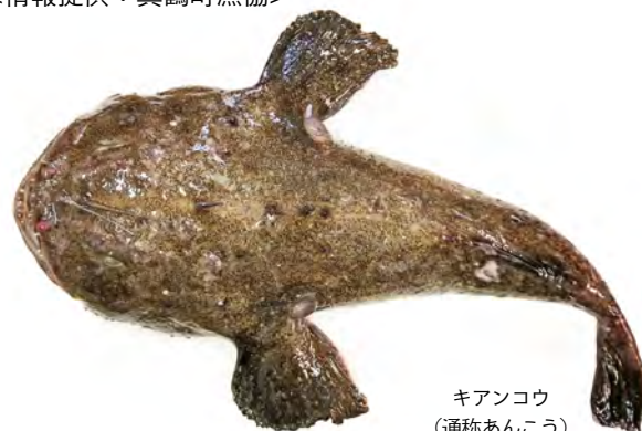
キアンコウ (通称あんこう)