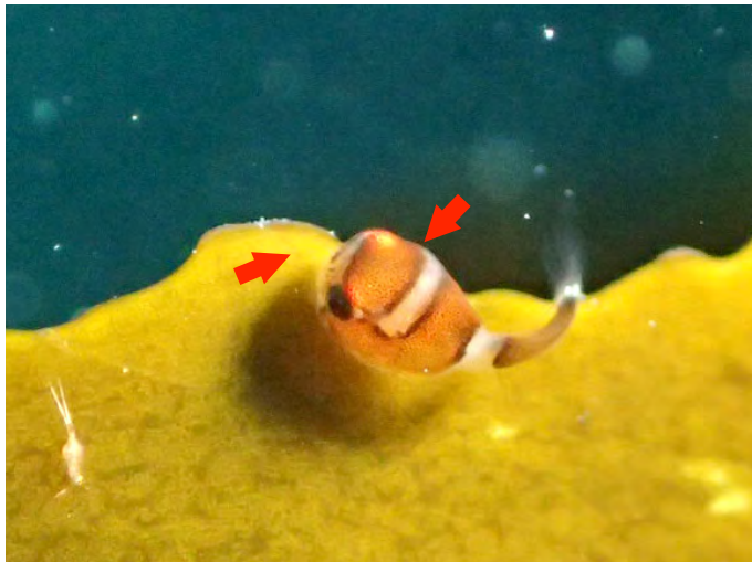
ダンゴウオの幼魚。頭の「天使の輪」模様(矢印)がもうすでに消え始めている(3月13日撮影)。

春の訪れが待ち遠しいこの時期、ダイバーに人気なのが、「天使の輪」を持つダンゴウオの幼魚。「天使の輪」というのは頭にあるリング状の模様の通称で、成長に伴って消えてしまうため、ふ化後1ヶ月くらいのわずかな期間しか見ることができません。全長わずか1-2mmのダンゴウオの幼魚を水中で探すのは大変で、さらに、ほとんど肉眼では確認できないこの「天使の輪」をうまく撮影するのは困難を極めます。しかし、この期間限定のレアさ、そして何と言ってもそのかわいさのおかげで、写真に収められた喜びはひとしおです。そんなところもダンゴウオ人気の秘密かもしれません。