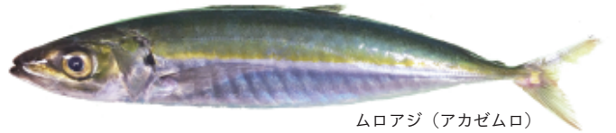
ムロアジ(アカゼムロ)

真鶴町漁協では、4月から続く長い不漁が7月に入ってからも続いていました。連日の大雨により、沿岸域では海水も茶色く濁り、魚も沖に出てしまうようです。大雨の影響が治まると定置網に入る魚も増えましたが、水揚げされた魚種は、驚いたことにアンコウやクロシビカマス(スミヤキ)など冬を代表する魚でした。沿岸で強風が吹くと、風向きによっては沿岸水が沖へ移動し、真鶴のように深海に近い場合は、深場の水が上昇することがあります。横浜国大の調査でもこの現象は確認されており、真鶴周辺の沿岸では、浅場と深場で海水の入れ替えが頻繁に起きていると考えられます。アンコウなどは今の時期は深場にいるはずですが、今回大雨をもたらした低気圧による強風の影響で、上昇してきた深場の水に乗って浅い海へやってきたのかもしれない。夏の定置網にも時々入ることがあるそうです。