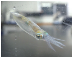
港を泳いでいたアオリイカの子ども、体長4cmほど(岩漁港にて採集)

産卵から20日前後で卵が孵化して、稚イカが飛び出します。体長1cmほどの稚イカは、孵化直後から上手に泳ぐことができ、墨も吐くことができます。外敵が多い海で身を守るための能力を備えて出てくるのですが、残念ながら、ほとんどの稚イカは他の生物に食べられてしまいます。厳しい環境を生き抜いて少し成長したアオリイカが、今後、海岸や港内でも見られるようになります。ぜひ探してみてください。