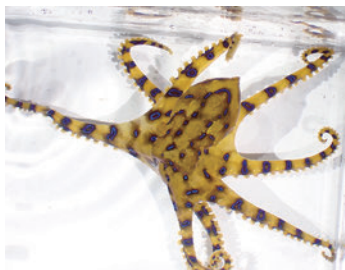
三ツ石海岸で見つかったヒョウモンダコ。刺激を受けて青いリング状の模様が出ている。

猛毒をもつヒョウモンダコですが、大きさは10cm程度と小型で、危険を察知すると現れる鮮やかな青色の模様が美しく、意外にも可愛い生物です。