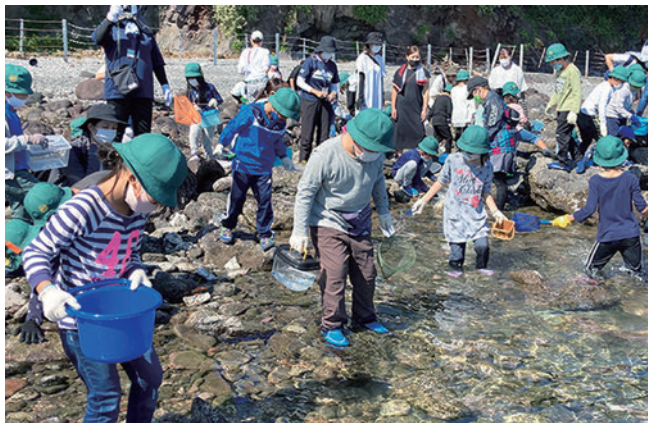
「海の学校」で磯の生物観察を楽しむまなづるの小学校2年生。大ヶ窪にて。

真鶴町の海には、例年多くの小中学校が体験学習や遠足に訪れますが、今年は新型コロナウイルスの影響を受け、中止や延期が相次いでいました。9月末の緊急事態宣言の解除に伴い訪問が再開され、町内の各地で海での活動を楽しむ子ども達の歓声が響き、いつもの賑やかさが戻ってきました。多くの児童・生徒が神奈川県内各地や東京都内から訪れ、磯の生物観察や町立遠藤貝類博物館の見学、真鶴町漁協の指導によるひものづくりなど、海の町ならではの体験プログラムを楽しみました。